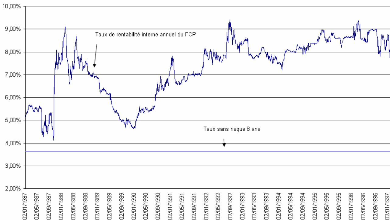
Evolution des taux de rentabilité interne annuel en fonction de la date de lancement du FCP

Le graphique suivant indique le taux de rentabilité interne en fonction de la date de lancement et non en fonction de la Date de Maturité du FCP.